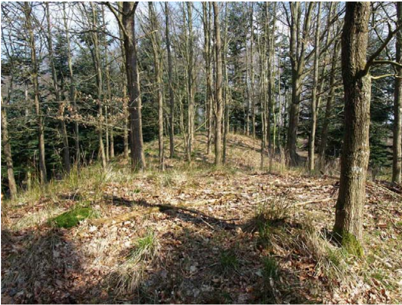
Sydhøjen med nordhøjen i baggrunden

Højen er først omtalt på side 44 i "Dysser og Gravhøje i Hvalsø kommune" udgivet af Danmarks Naturfredningsforening Lokalkomiteen for Hvalsø, fra 2003.